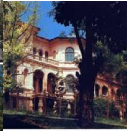
Palatul lui Manuc in Basarabia